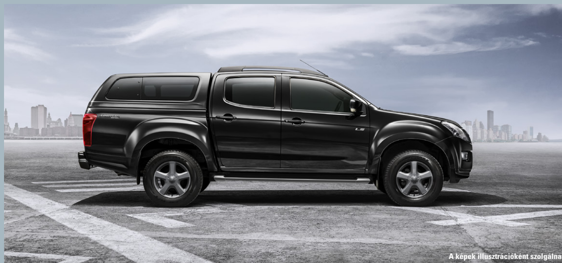
A képek illusztrációként szolgálnak