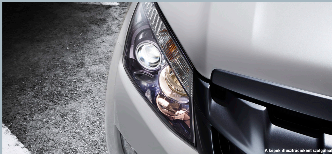
A képek illusztrációként szolgálnak