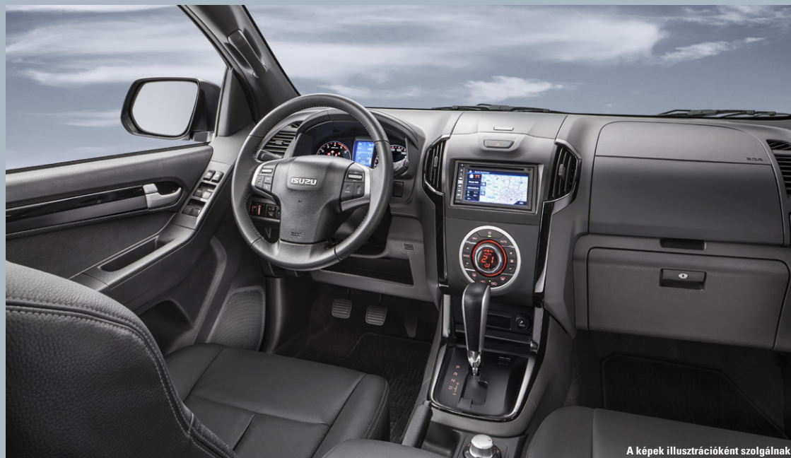
A képek illusztrációként szolgálnak

Standard: S Nem elérhető: X Opcionális: O – Részletekért érdeklődjön márkakereskedéseinkben